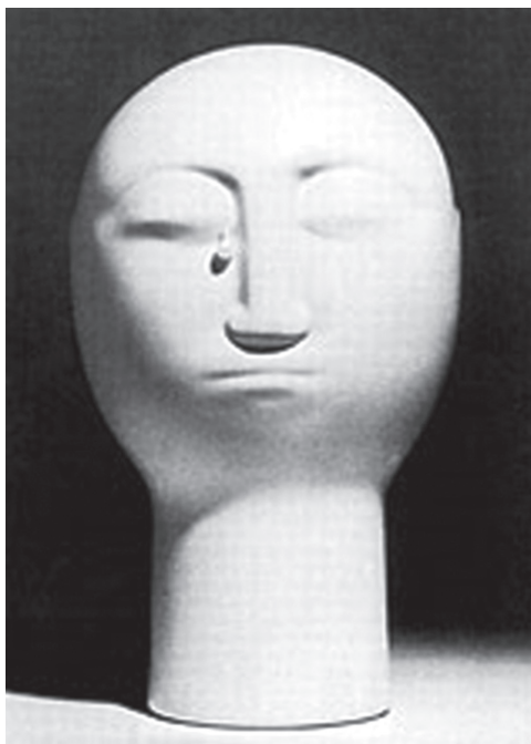
Az animációs film „a Fejek”-ről szól