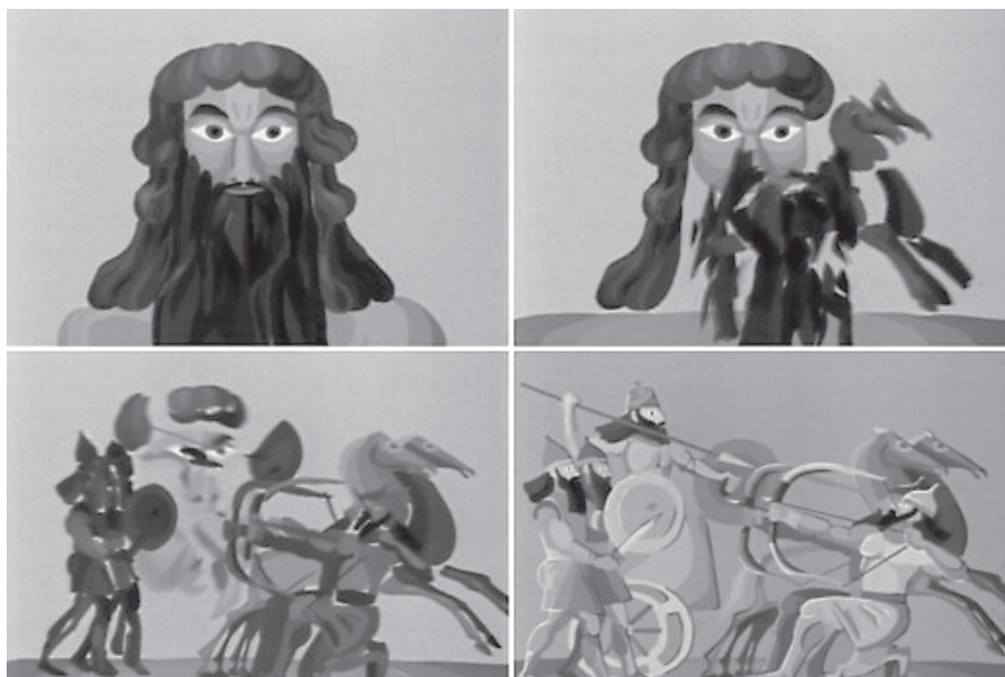
(Az ősi kultúrák ciklikus széthullásából egy képsorozat)